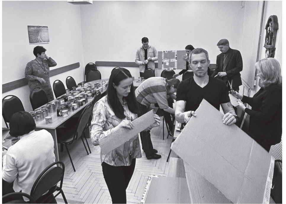
Сотрудники ТЭЦ-1 изготавливают свечи