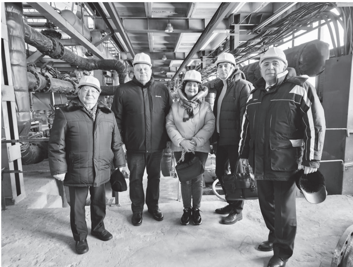
Экскурсия по ТЭЦ-1 для представителей Камышинской ТЭЦ

Затем ознакомили ребят с электроустановками котельного цеха и работой диспетчерской службы предприятия.