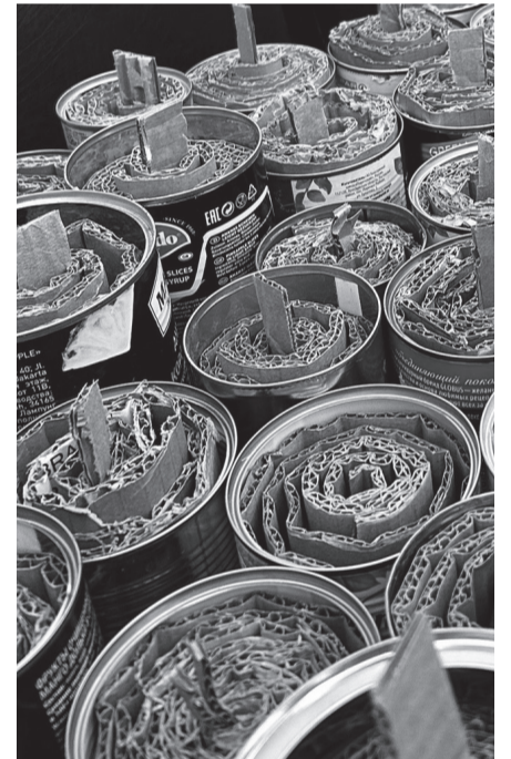
Готовые окопные свечи

Напомним, что еще в марте 2023 года сотрудники ТЭЦ-1 подготовили партию и организовали отправку окопных печей для бойцов СВО. Компактные печи военнослужащие могут использовать и для обогрева, и для приготовления пищи. Для изготовления печей в ход шли отработанные трубы. И пусть вид у них не совсем «гламурный», но на нашем предприятии уверены — главное не в этом. Зимой такие нагреватели — это незаменимые помощники бойцам: и одежду с обувью высушить, и еду приготовить, и воду согреть. В швейном цеху ТЭЦ-1 было изготовлено более 100 пар рукавиц для бойцов. Руки в них не замерзнут благодаря шерстяному утеплителю и двум слоям водоотталкивающей ткани снаружи и внутри.