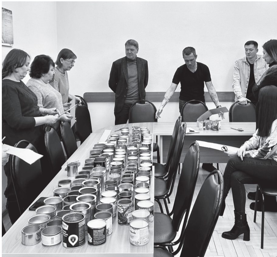
Сотрудники ТЭЦ-1 обсуждают изготовление окопных свечей

нок и 66 кг парафина. Благодарим всех неравнодушных коллег за ваш отклик и вклад в общественно полезное дело. Совсем скоро наши огни тепла отправятся в зону Специальной военной операции.