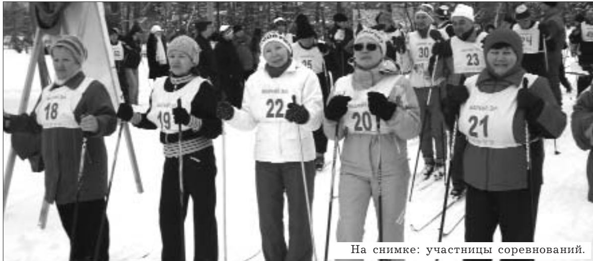
На снимке: участницы соревнований.