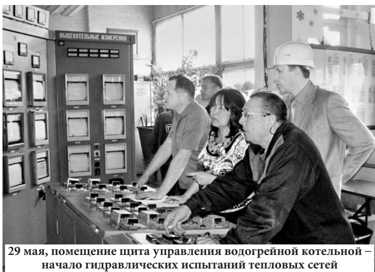
29 мая, помещение щита управления водогрейной котельной – начало гидравлических испытаний тепловых сетей